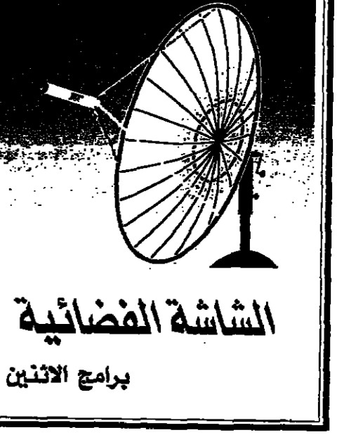
الشاشة الفضائية برامج الاثنين